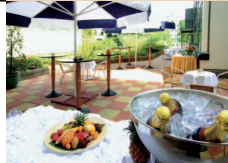
Terrasse / terrace

Parking garage and outdoor parking space are available (parking fees will apply).